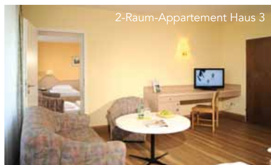
2-Raum-Appartement Haus 3