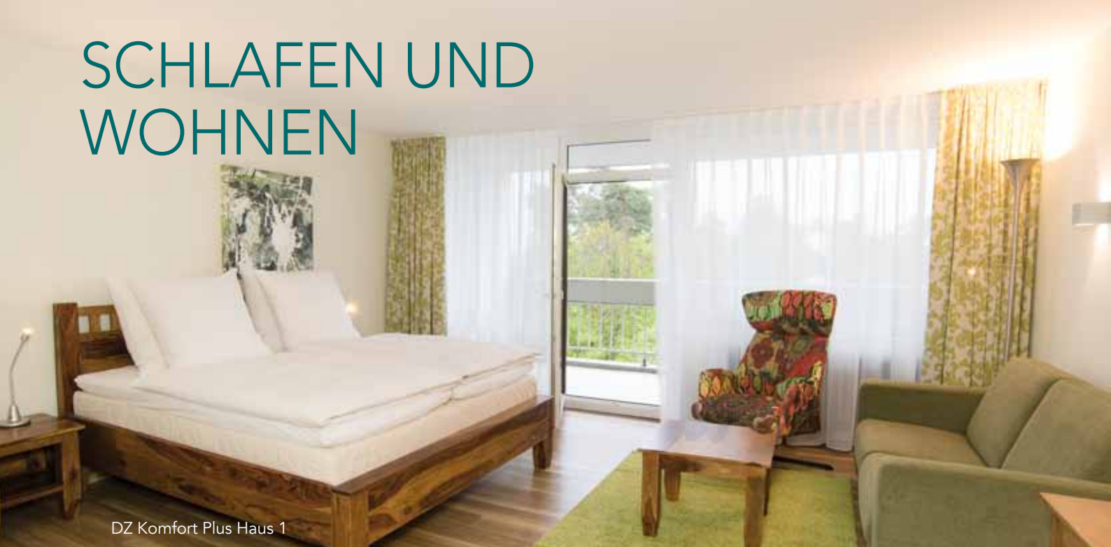
DZ Komfort Plus Haus 1

Die 380 Hotelzimmer sind auf drei miteinander verbundene Gebäude verteilt. Die Häuser 2 und 3 sind über den Bürgersteig oder über den Verbindungsgang im Inneren (mit Stufen und Brandschutztüren) vom Haupthaus aus erreichbar.