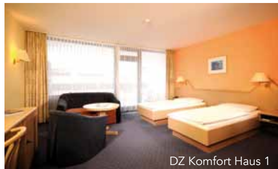
DZ Komfort Haus 1

Für Kinder bis 2 Jahre stellen wir gerne ein Babybett, Windeleimer und Wickelaufgabe im Zimmer bereit (im Kinderpreis inklusive). Bitte melden Sie dies im Vorfeld an. Allergikerzimmer sind auf Anfrage und nach Verfügbarkeit in einzelnen Kategorien buchbar, ebenso Zimmer, welche mit Hund bezogen werden können.